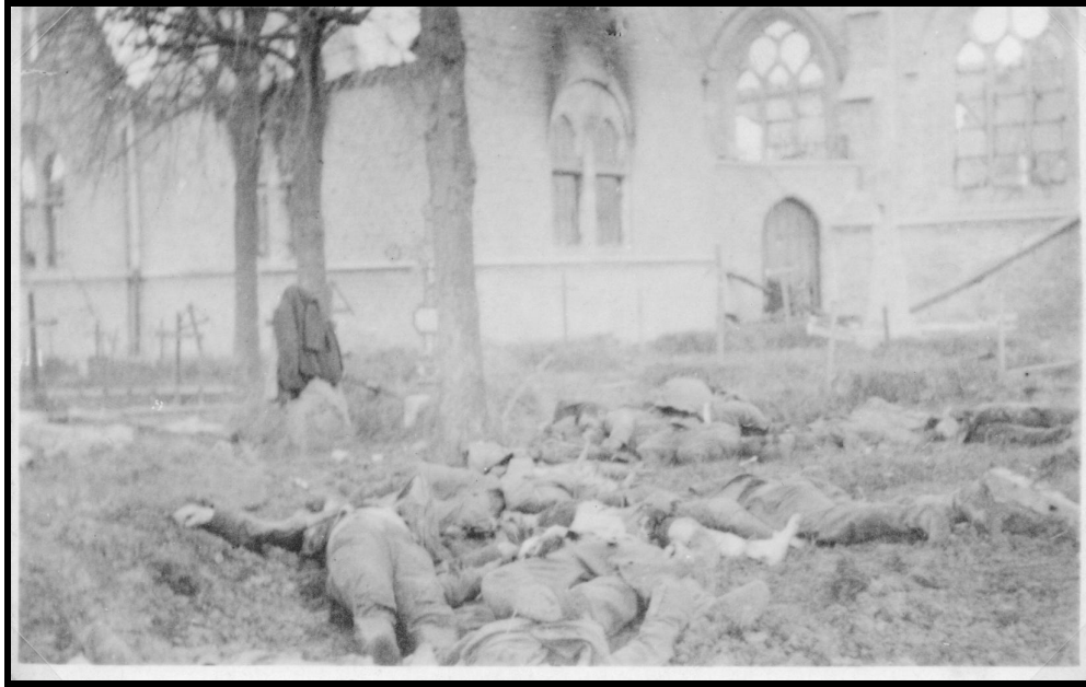
Foto 2. 31 oktober 1914. Tussen de kerk van Pervijze en de straat wordt een massagraf aangelegd voor 115 Duitse militaire slachtoffers van de eerste gevechten nabij Pervijze. Een eenvoudig houten kruis zal nadien de aanwezigheid van het massagraf markeren: “115 Allemands R.I.P.”.