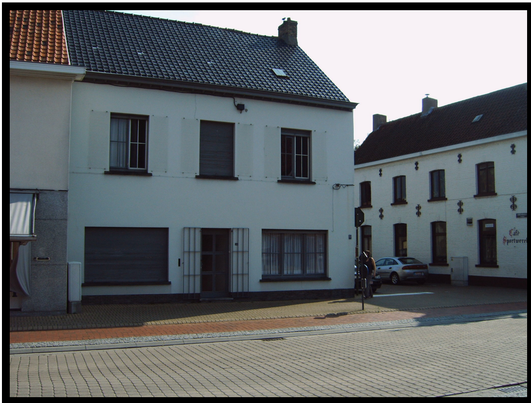
De toenmalige woonplaats van de familie Scherpereel te Dudzele anno 2007.

Vertalingen naar het Nederlands: P.De Vuyst