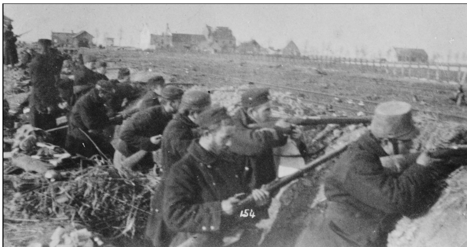
Foto 1. Belgische infanteristen achter de spoorwegberm Diksmuide – Nieuwpoort. Bemerkt dat er nog geen inundatie is tussen de spoorwegberm en de rivier de IJzer.

Deze tekst poogt een beeld te schetsen van de omstandigheden waarin Lodewijk Scherpereel omkwam tijdens de IJzerslag en dit aan de hand van een veelvoud van verschillende bronnen.